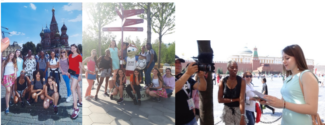
Projet international "Ouvrez votre Russie"