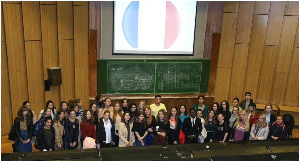
Cours de français

Enfin, la dernière journée du printemps, on a fait le 1 er jeu intellectuel international "Coupe de l'Amitié" comme le dernier événement de cette année universitaire. Il y avait 3 tours avec 10 questions dans chacun. Et pendant la pause, nous avons offert à nos participants des gâteaux et du thé.