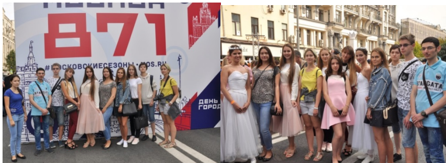
Journée de la ville, promenade à Moscou, automne 2018

En même temps, nous organisons des excursions au centre de Moscou en 3 langues (russe, anglais, français) pour tous les membres de notre club 2 fois par an, à l'automne et au printemps. Les étudiants découvrent l'histoire du centre de Moscou et des curiosités environnantes.