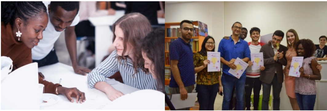
1 er jeu intellectuel international "Coupe de l'Amitié"