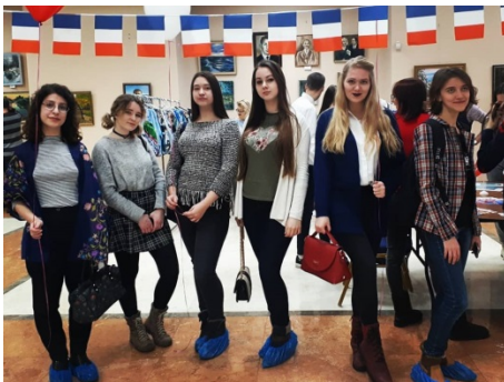
Journée de la culture française au musée ArtDéco

On aime particulièrement les événements liés à la France et à la langue française. Par exemple, la journée de la culture française au musée Art Déco. Nous avons visité l'exposition permanente, écouté des ateliers intéressants et, bien sûr, goûté des fromages français ! L'exposition du musée Art Déco est un événement extraordinaire pour les vrais connaisseurs d'art ! Style Art Déco est digne du statut d'antiquité exclusif !